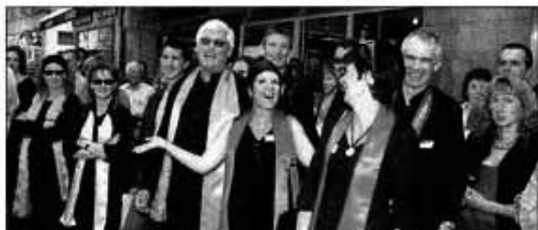
CONVIVIALITÉ Neuchâtel accueillait ce week-end le festival romand de gospel. Ambiance samedi dans les rues de la ville.

Remue-ménage samedi au centre-ville de Neuchâtel sur la scène ouverte à côté du temple du Bas. Cent chanteurs gospel munis de leurs écharpes colorées tentent de se faire une place. Miracle: après plusieurs essais, tous tiennent sur cet espace restreint et surélevé.