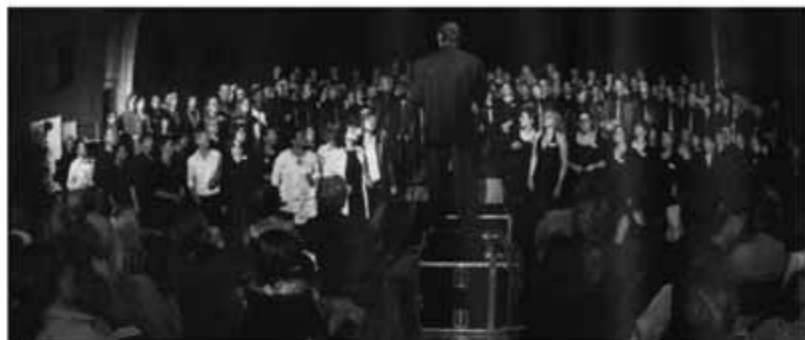
Le concert de gala a réuni les meilleures formations de Suisse romande. Avec, en point d'orgue, un très émouvant morceau d'ensemble, avec près de 300 voix à l'unisson.

MARTIGNY ► Le Gospel Air a envouté la ville durant deux jours. Près de 400 chanteurs se sont relayés sur les quatre podiums installés au centre de la cité, donnant à la Dranse des airs de Mississippi.