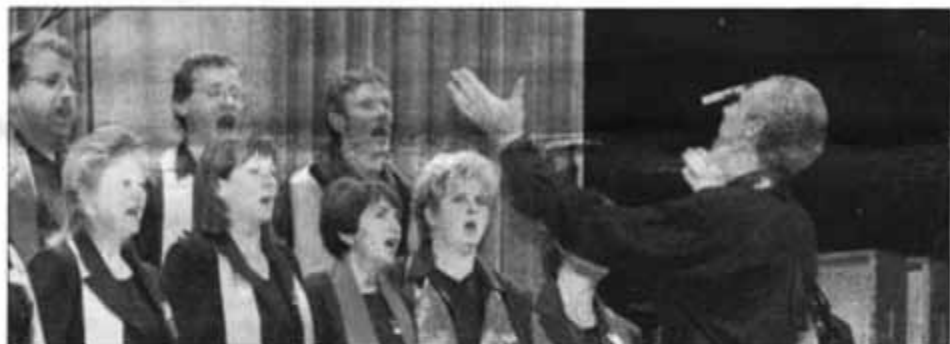
Le gospel (ici le groupe Azimut lors du concert final hier à la salle Del Castillo) exprime divers sentiments, parfois contradictoires.

Samedi et dimanche, Vevey a accueilli la deuxième édition du festival Gospel Air. L'occasion de redécouvrir la ville en se baladant d'une scène à l'autre.